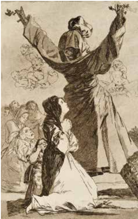
Blatt | Plate 52: Lo que puede un sastre! Kleider machen Leute! What a tailor can do!

While reason may shine its immaculate light to reveal reality, it is imagination which gives reality its face, body, wings, horns, and claws. In Goya's 80 captioned etchings forming the series Los Caprichos , witches, goats, bumbling generals, and newly-weds parade through the darkness of unreason, demonstrating the fiendish and foul banalities of society. Goya worked on the prints between 1797 and 1799, when the powers of Europe began to fray in the wake of the French Revolution. Los Caprichos aims not only to unmask the deceits of authority but criticizes also the complacency and solipsism in all manifestations of Spanish society.