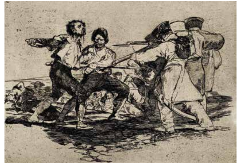
Blatt | Plate 2: Con razon ó sin ella Zu Recht oder zu Unrecht Rightly or wrongly

Blatt | Plate 1: Tristes presentimientos de lo que ha de acontecer Traurige Vorahnungen dessen, was sich ereignen wird Cloudy premonitions of what will happen