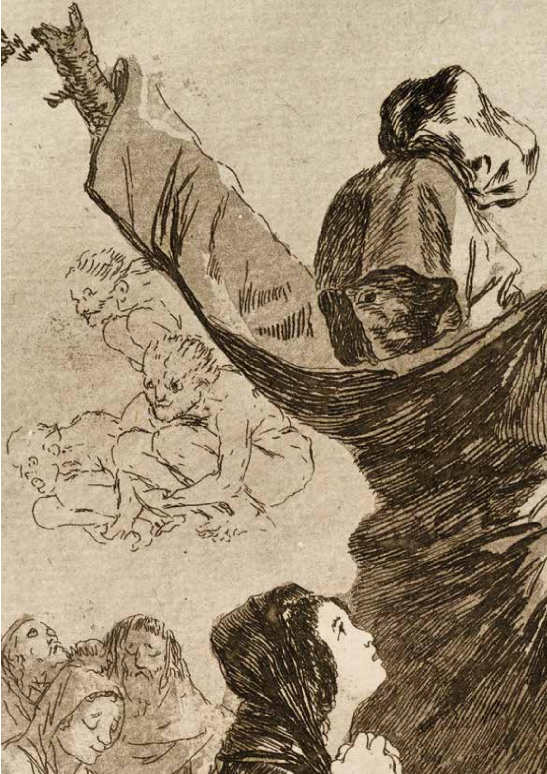
Blatt | Plate 61: Volaverunt. Sie sind davongeflogen. They have flown.