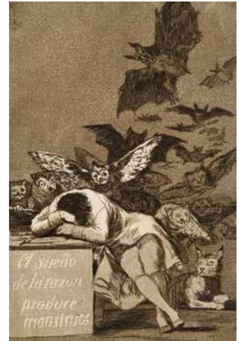
Blatt | Plate 43: El Sueño de la Razón produce monstruos. Der Schlaf der Vernunft gebiert Ungeheuer. The sleep of reason produces Monsters.

Selbstgefälligkeit und die Egozentrik in allen Bereichen der spanischen Gesellschaft.