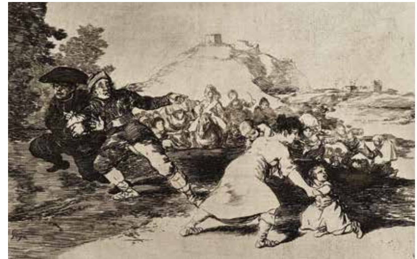
Blatt | Plate 44: Yo lo vi Ich sah es I saw it