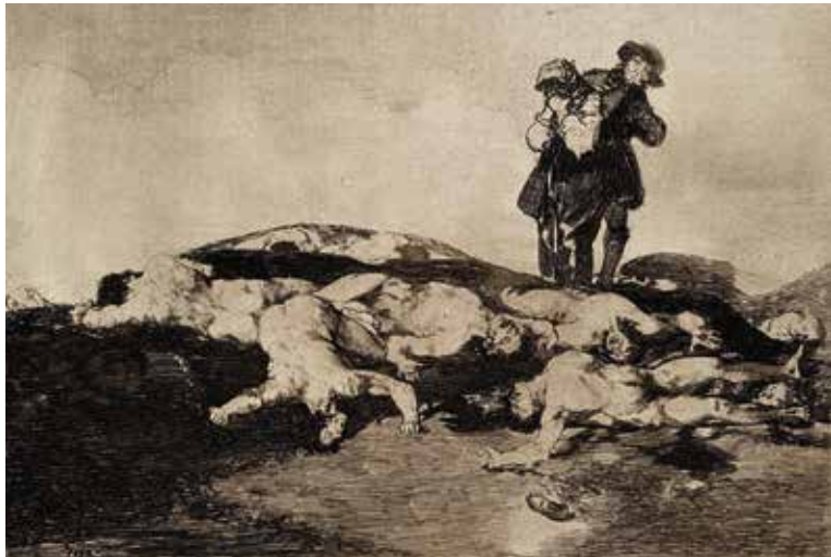
Blatt | Plate 18: Enterrar y callar Begraben und schweigen Bury and shut up

ins Mark, und wir sind so schockiert, als hielten wir die Patronenhülse, das befleckte Hemd, den letzten verbliebenen Zielstein des Hauses direkt in unseren Händen. Im Elend des Krieges sind die Menschen gezwungen, ihre Gedanken auf das Überleben zu richten, sich die Verletzlichkeit des Körpers ins Gedächtnis zu rufen und vor allem eine Vision von der Welt zu bewahren, die ihnen eine Zukunft gewährt. Goya lässt diese Vision in der Serie Los Desastres de la guerra unrealisiert: „Die Wahrheit ist gestorben“, lautet der Titel des 79. Blatts, und es folgt, auf dem 80. Blatt, die Frage: „Wenn sie wieder auferstehen würde?“